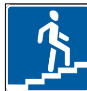
Знак «Надземный пешеходный переход»