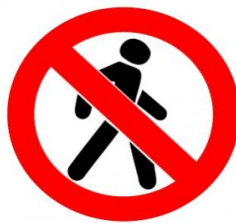
Знак «Движение пешеходов запрещено»