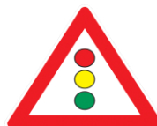
Знак «Светофорное регулирование»