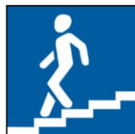
Знак «Подземный пешеходный переход»