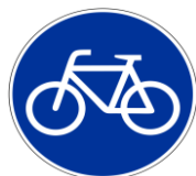
Знак «Велосипедная дорожка»