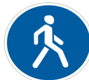
Знак «Пешеходная дорожка»