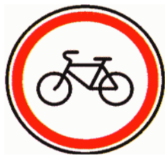
Знак «Движение на велосипедах запрещено»