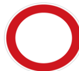
Знак «Движение запрещено»