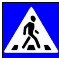
Знак «Пешеходный переход»