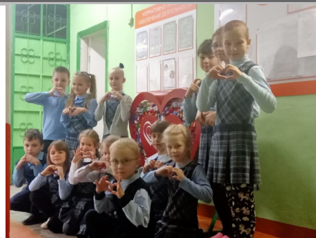
На фото : ученики 1-3 классов

- Приношу крышки на первый этаж в «сердце». Их перерабатывают, и деньги поступают в фонд, а фонд потом покупает дорогие лекарства и средства для передвижения. Им нужна наша поддержка.