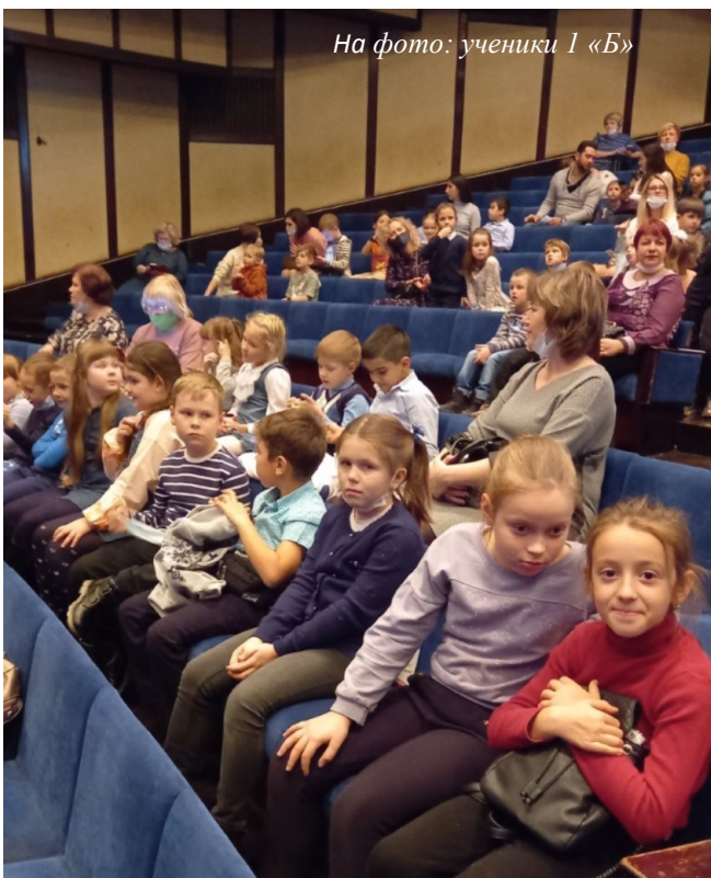
На фото: ученики 1 «Б»