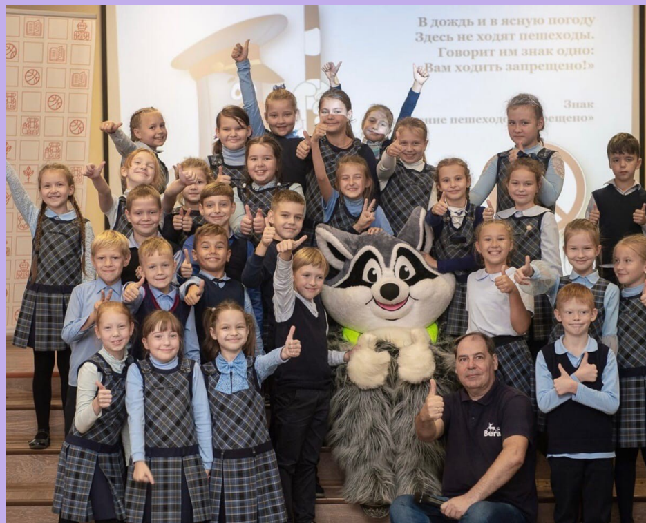
На фото: ученики 3 «А»