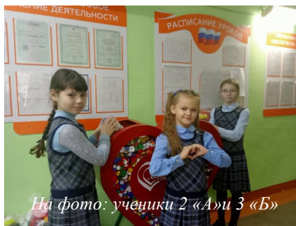
На фото: ученики 2 «А» и 3 «Б»

Акция проводится во всех образовательных и общественных учреждениях нашего округа, а также и в нашей школе. На первом этаже у нас установлена специальная урна в виде сердца, куда можно складывать пластиковые крышки. Потом их отвозят на вторичную переработку, а на счёт фонда помощи детям поступают денежные средства для детей с ограниченными возможностями. Цель акции - помочь семьям, которые нуждаются в приобретении технических средств реабилитации. Знают ли о такой акции ученики начальной школы и что о ней думают? Решили узнать у них самих.